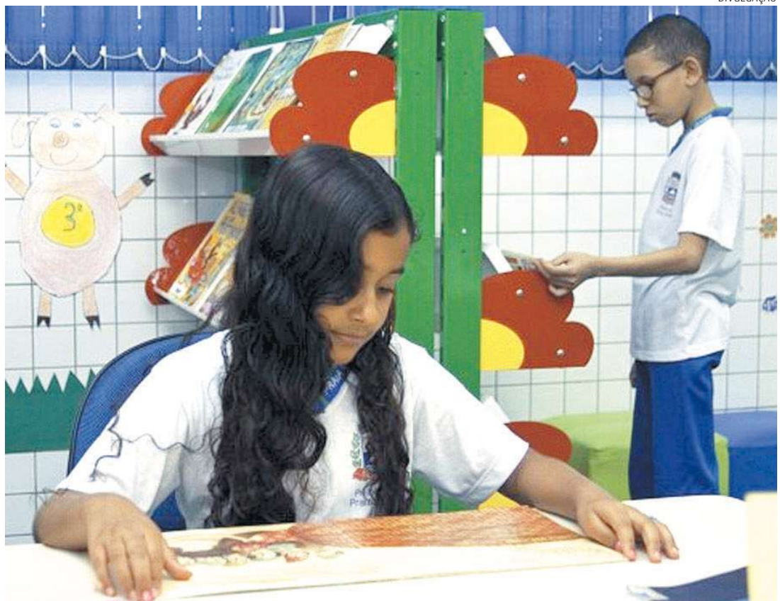
Das 25 bibliotecas praiagrândenses, 22 são escolares. Mais sete espaços são previstos até o final do ano